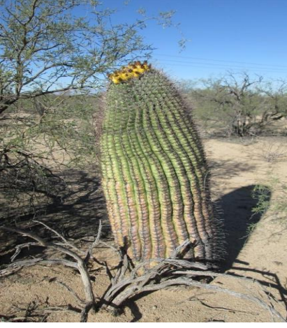
Barrel cactus بیریل سیکٹس