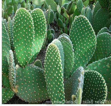
Bunny ear بنے ایر