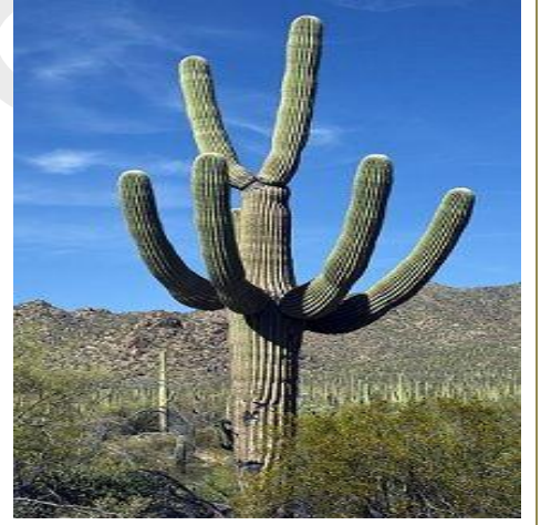
Giant Saguaro گیانٹ سگوارو

☆ کسی ریگستانی جانور جیسے اونٹ کے بارے میں سچی باتوں پر مشتمل ایک رپوٹ فائل تیار کریں۔