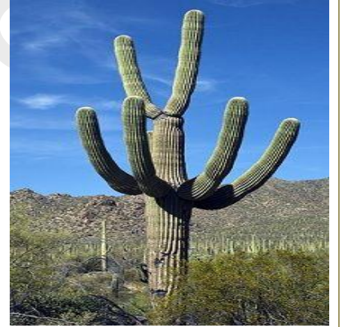
Giant Saguaro گیانٹ سگوارو