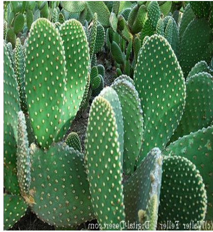
Bunny ear بنے ایر